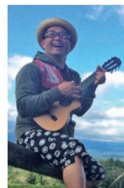
インスターズ こりまさのP ▶インスターズ公式ホームページ http://inustardu.com/

昨年、スタンプカード特設販 売会場を盛り上げてくれた 「こりまさのP」率いるイヌ スターズが、urayoko netの テーマソングを作ってくれ ました!このテーマソングは、 YouTubeで見ることができ ます。イヌスターズの活動も、 チェックしてみてください。